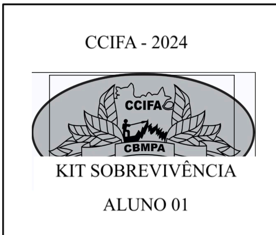
IMAGEM 2 – TAMPA DO KIT