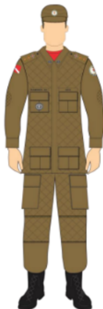
Figura 1 - UNIFORME DO ALUNO CCIFA 2024