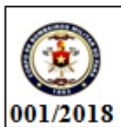
FIGURA 2 – Brasão do CBMPA